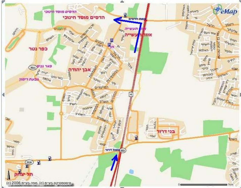
לבאים מדרום: נוסעים על כביש 4 (צהר); צומת דרום מתשישים ישר (צפונה) אחרי 3 ק"מ מגיעים לצומת הדסים ופונים בה שאלה. קילומטר 1 אחרי הפניה מגיעים להדסים.