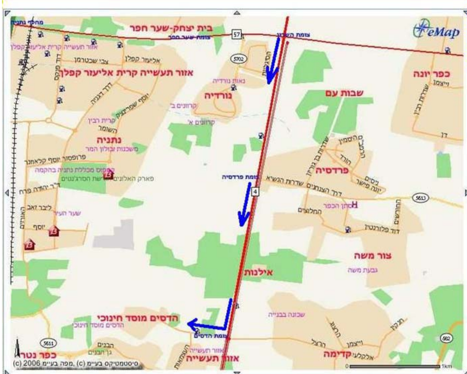
לבאים מצפון: נוסעים על כביש 4. אחרי צומת בית ליד (צומת השרון) מתשישים 4.5 ק"מ דרומה (חולפים בדרך על פני צומת פרדסיה). אחרי 4.5 ק"מ מגיעים לצומת הדסים. בהדסים פונים ימינה. קילומטר 1 אחרי הפניה מגיעים להדסים.